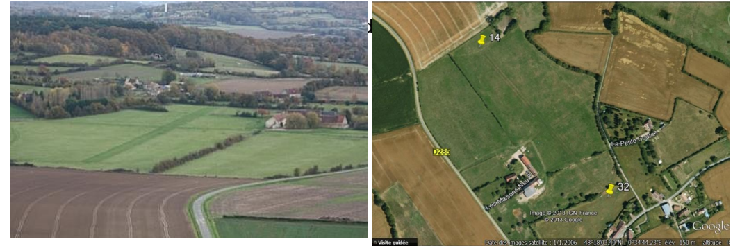
Aérodrome ULM de Saint GERMAIN DE LA COUDRE — LF6152